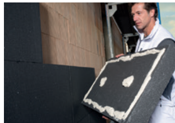
Siltumizolācijas plākšņu līmjavām un armēšanas javām