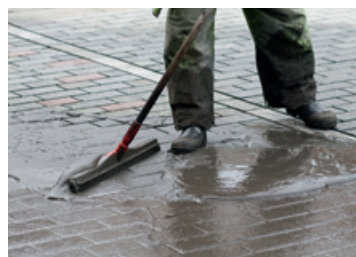
Javām šuvju aizpildīšanai