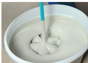
EP katted / värvid