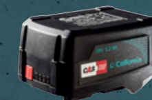
COL-20.677 CAS baterija 18 V, 5.2 Ah