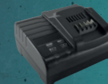
COL-20.678 Lādētājs ASC 30-36, piemērots visām Metabo Li- Power baterijām